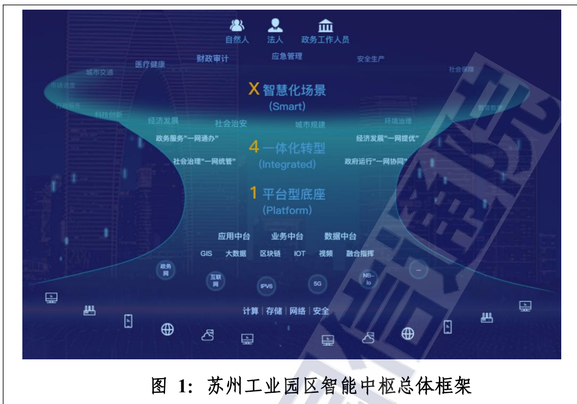
图 1：苏州工业园区智能中枢总体框架

第三类是数字资源统筹型智能中枢，通过构建统一规划、统一架构、统一标准、统一运维体系，实现城市数字资源台账式管理。一是以数字资源编目化管理促进集约利用。浙江、重庆、西安等地统筹整合分散在各部门的云、网、数据、能力组件、业务组件、应用系统等各类型数字资源，建设资源型智能中枢，并通过“一本账”编目化管理，实现资源复用，避免重复建设。二是以数字资源整体运营提升资产价值。部分地区通过标准化、编目化、一体化管理运营模式，盘活全市存量数字资产，加强资产评估评价，提升资产准确性、可用性和鲜活度。