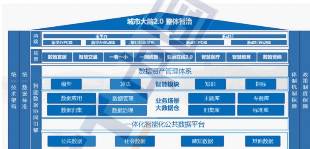
图 2：浙江省一体化智能化公共数据平台总体架构

System，简称 IRS）综合集成算力、数据、算法、模型、业务智能模块等数字资源，构建数据采集、存储、归集、治理、应用、管理和智能等全生命周期流程能力体系。以应用需求为导向，聚焦“归数”“治数”“用数”等环节，按照统一技术架构，按需全量全要素归集公共数据、社会数据、感知数据及其他数据，形成数据、模型、算法、指标等数据资产，沉淀共性数据服务能力，以快速响应业务需求，支撑数据融通共享、决策分析和智能研判。如浙江省金华市通过 IRS 应用目录，对市本级各部门申请的拟建项目开展应用功能查重，逐步减少项目功能点重复开发，节约财政投资。